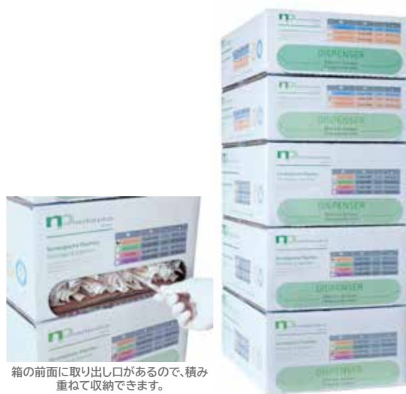
箱の前面に取り出し口があるので、積み重ねて収納できます。