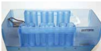
抗体・洗浄液タンク