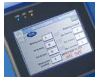
操作タッチパネル