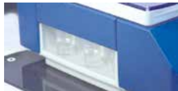
1次抗体回収バイアル