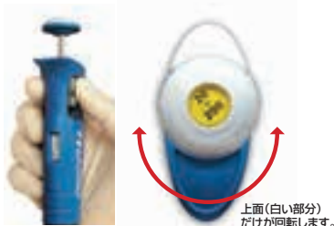
上面(白い部分)だけが回転します。