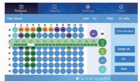
Plate Layout Screen

MR9600-Tは、処理中のプレートをインキュベートするための精密な温度制御が可能なモデルです。環境温度より5℃高い温度から50℃まで維持することができます。