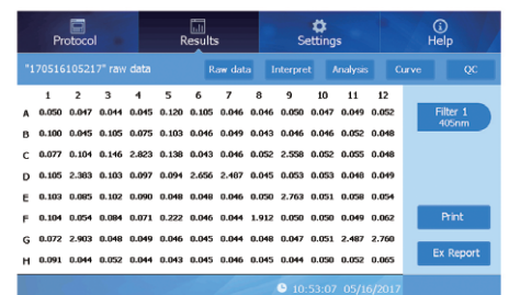
Reading Results Screen